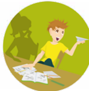
kreativ - chaotisch