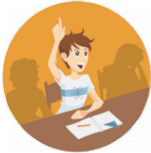
logisch - abstrakt